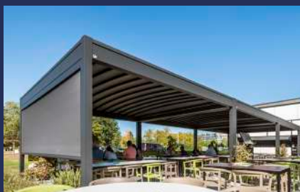
Pergola Toit Rétractable